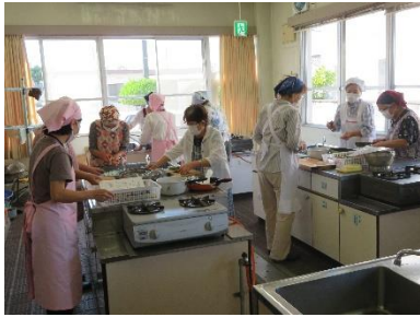
【湯田学区食生活改善推進員協議会】