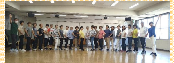
【湯田学区まちづくり推進委員会】