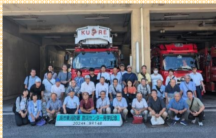
呉市防災センター

誰一人犠牲者にならないため、常日頃から家族間で避難の心構えや防災グッズの準備等について話し合っておきましょう。