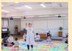
【社会教育活動事業】【湯田学区の福祉を高める会】