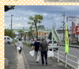
【湯田学区まちづくり推進委員会】【湯田学区公衆衛生推進委員会】