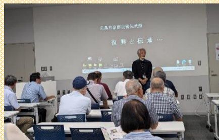
広島市豪雨災害伝承館