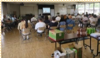
【湯田学区人権啓発推進連絡協議会(団体別学習事業)】