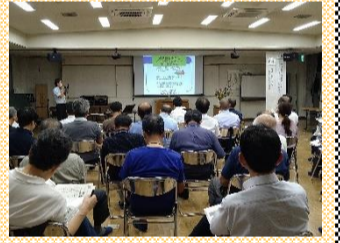
【湯田学区人権啓発推進連絡協議会】